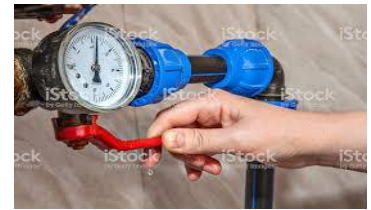
Zatvorite glavni ventil za vodu