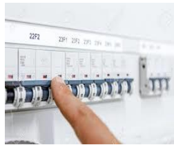
Isključite glavnu sklopku