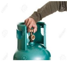
Zatvorite plinsku bocu

Minimalno se krećite tokom potresa. Ne stvarajte paniku. Nastojte što kraćim putem doći do najbližeg sigurnog mjesta. Ostanite u kući dok potres ne prestane, a zatim što mirnije izađite na otvoreni prostor podalje od građevina. Barem za djecu nastojte ponijeti tople odjevne predmete i pokrivače. Ponesite dokumente, novac i lijekove za bolesne članove porodice. Ako ste u mogućnosti, ponesite i prvu pomoć kao i hranu i vodu. Kao i u većini slučajeva (vezano za većinu prirodnih ili drugih nesreća) potrebno je da svi ukućani znaju gdje je glavna sklopka za struju, te gdje su glavni ventili za plin i vodu, i kako se zatvaraju (isključuju). Po mogućnosti je potrebno na dohvata ruke imati već pripremljena "priručna" sredstva (bateriju, tranzistor, torbu za prvu pomoć itd.).